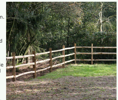
Figuur 1: Sallands hekwerk

Eisen m.b.t. de bouwfase en uitvoeringswijze.