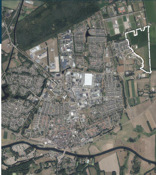
Locatie Vlierlanden Fase 2