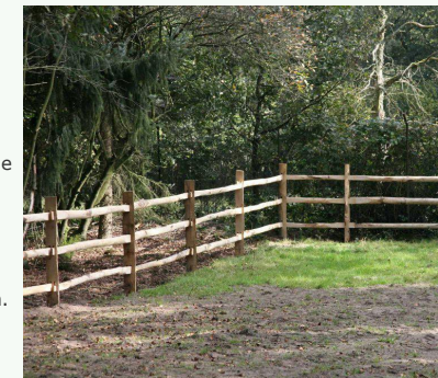
Figuur 1: Sallands hekwerk

Eisen m.b.t. de bouwfase en uitvoeringswijze.