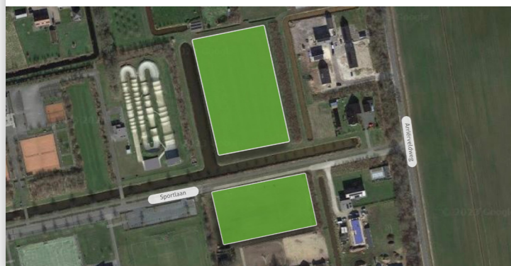
percelen voor flexwoningen aan de Sportlaan